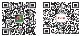
黄港宣传公众号 黄港日报公众号

好的，关于“辰”字，我们就聊到这儿，感谢大家的收听，下期再见。（讲课音频扫码关注公众号）