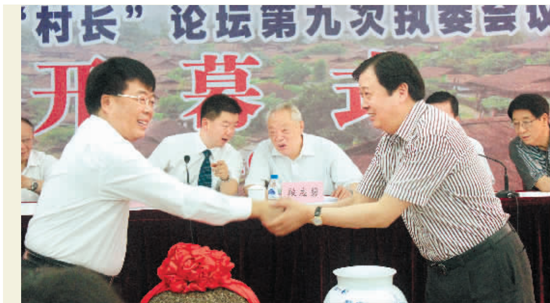
吴协恩书记与临沧市委书记李平共同剪彩。