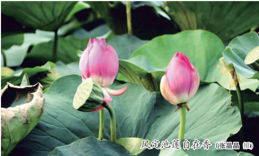
风定池莲自在香