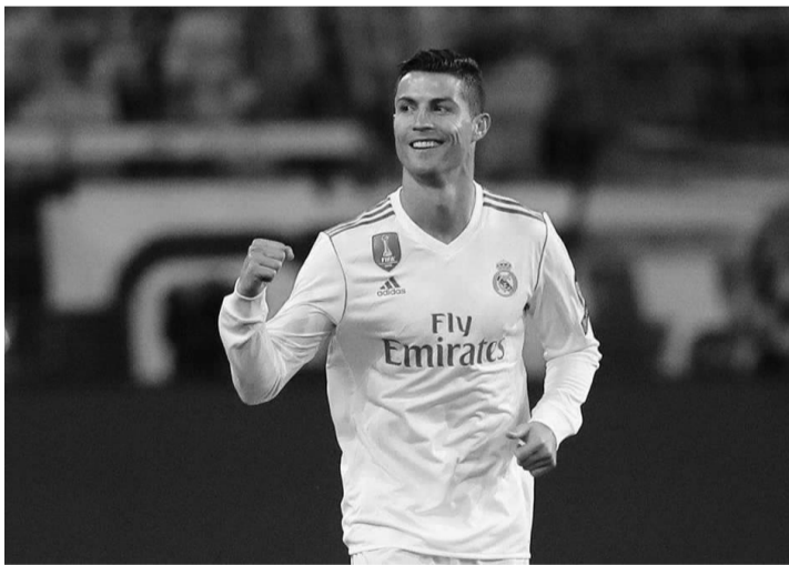
日前，C罗确认离开效力了9年的皇马。

金球奖；在这里，他从一位优秀球员成长为足以载入国际足球历史的传奇人物。从此前的表态来看，C罗曾经的确希望能够在皇马退役，但是俱乐部的一些做法却伤害了自尊心极强的他。据悉，不仅是C罗向皇马提出的3000万欧元年薪未得到满足，而且皇马时不时与姆巴佩、内马尔等球员眉来眼去也让他与俱乐部产生隔阂。