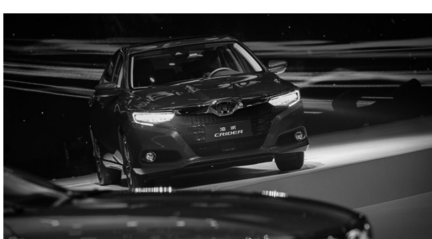
星齿变速箱,采用先驱先行、智领前沿的革新性第四代SH-AWD超级四轮驱动自由控制系统,正式启动预售。本次ALL NEW RDX共发布了四款预售车型及预售价格,分别为畅享版34.8万元、悦享版36.8万元、尊享版38.8万元及智享版SH-AWD 39.8万元,将于今年11月正式上市。记者 于凤国

9月27日,2018广汽本田品牌之夜暨新一代凌派(CRIDER)上市及ALL NEW RDX预售发布会在广州亚运城隆重举行。新一代凌派拥有令人瞩目的车格、愉悦的舒适驾乘感受以及惊喜的动力性能油耗和Honda SENSING带来的越级安全享受,市场指导价为9.98万元至13.98万元。新一代凌派携全新的动力平台而来,采用Honda 180TURBO直喷涡轮增压发动机,动力性能优异之余还实现了极佳的燃油经济性,百公里油耗仅为4.9L。广汽本田特别为新一代凌派用户打造了专属的金融方案:首付1万元起,余款(含购置税及保险)最高可享3年0利率。作为广汽Acura第三款国产战略车型,ALL NEW RDX首次搭载了2.0T直喷VTEC涡轮增压发动机,匹配同级唯一10AT行