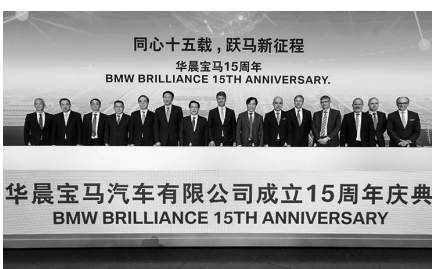
华晨宝马汽车有限公司成立15周年庆典 BMW BRILLIANCE 15TH ANNIVERSARY

昨天,在华晨宝马成立15周年之际,宝马集团和华晨汽车集团达成战略合作升级:合资协议延长至2040年,对华晨宝马新增投资30亿欧元,用于拓展建设项目;以期未来三到五年内,华晨宝马年产量增至65万辆,新增5000个工作岗位。华晨宝马集团自2003年成立以来,已发展为中国最成功的豪华车制造商之一,现拥有18000名员工,业务涵盖BMW汽车的生产、销售以及产品的本土化开发。