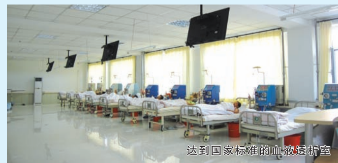
达到国家标准的血液透析室