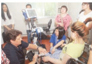
邀请加拿大、美国康复专家来医院讲学