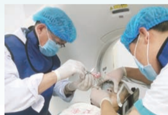
附属人民医院对3D打印技术的应用