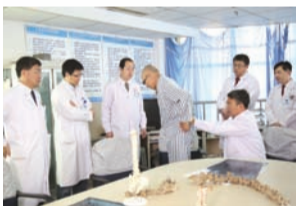
骨科团队认真讨论分析病历