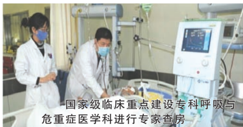
国家级临床重点建设专科呼吸与危重症医学科进行专家查房