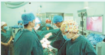
普外科C区进行首例全腹腔镜下肝左外叶切除术

建立了远程医疗会诊及医学教育中心,涵盖了全区12个盟市的83个旗县市区的110家二级医院,为患者累计节省340多万元医疗开支。