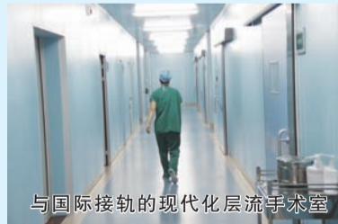
与国际接轨的现代化层流手术室