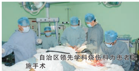
自治区领先学科烧伤科为患者实施手术