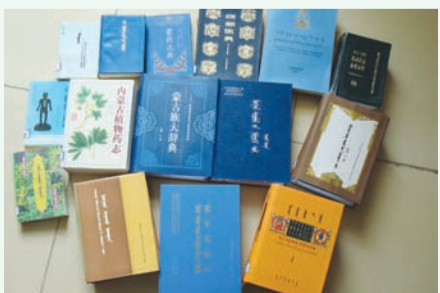
《蒙医眼科学》是一部中国医学高等院校蒙医专业蒙医眼科学教材。由巴日格其于1986~1990年编写,于1990年由北京民族出版社用维吾尔金蒙古文出版发行。1974年,我国首次发行了蒙医药学术专刊《蒙医药》杂志(蒙古文版)。