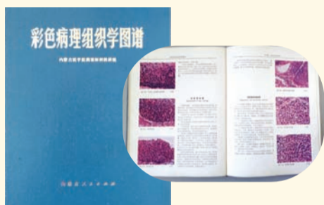
国内第一本彩色病理学图谱由我校主编出版。