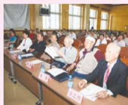
1977年11月20日,学校召开首届科技大会。