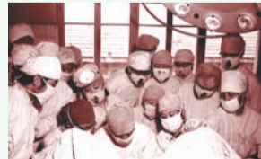
1987年,附属医院耳鼻喉科在自治区首次开展面神经-舌下神经吻合术,填补了自治区空白。