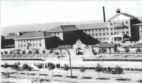
1956年,国家首次在内蒙古自治区建立一所医药类普通高等学校——内蒙古医学院。