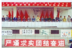
1978年,我校确定了第一个校训——严谨求实,团结奋进。