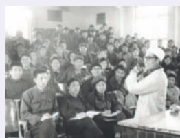
1980年,内蒙古医学院蒙医学专业招收第一批硕士研究生。