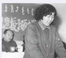
1981年,学校获首批拥有硕士学位授权资格单位。