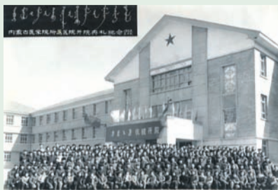
内蒙古医学院附属医院 1958年3月8日开诊,是内蒙古自治区第一所医药类高校的教学医院。