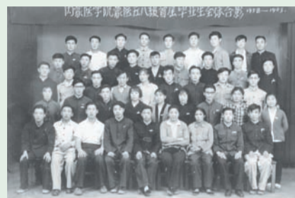
1958年9月,内蒙古医学院建立了中蒙医系。次年招收蒙文医士班,40名学生入学。开创了新中国蒙医高等教育的先河。1963年首届蒙医学本科生毕业,成为我校为国家和社会培养的第一批蒙医高级人才。