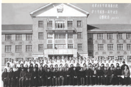
1958年,我校招收第一届护士。