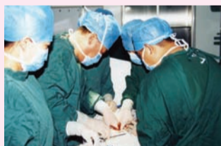
1965年,附属医院全国首创地研究了用髂内动脉结扎减少前列腺开放手术的出血量。