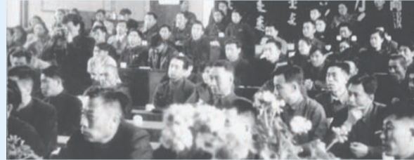
1968年3月18日,学校召开了首届学生代表大会。