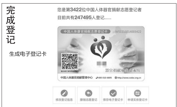
记者 戴余乐 制图