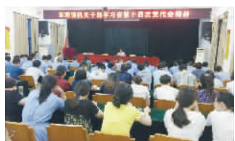
6月19日晚上，越城区东湖镇召集全体机关干部，深入传达学习省第十四次党代会精神，对贯彻落实工作作出部署。

昌安社区 “七一”来临前夕，越城区蕺山街道昌安社区邀请入党50年以上的老党员欢聚一堂，重温党的光辉历程，庆祝中国共产党成立96周年。年轻党员们给每位老同志胸前戴上入党50年、60年的纪念徽章，老同志都非常激动。(裴培荣)