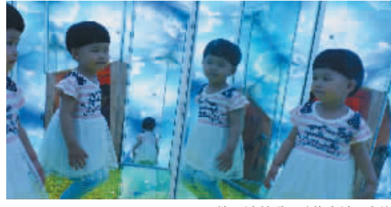
数不清的我