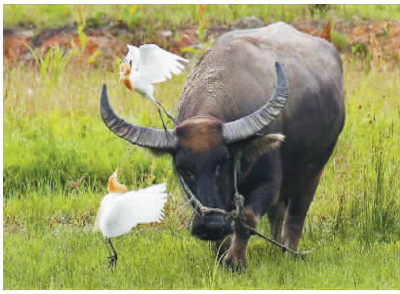
调戏老牛