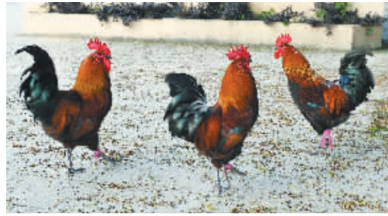
三足鼎立

孝廉文化长廊建立后,受到河山桥社区居民以及党员干部的一致称赞。很多居民有空都喜欢到长廊来坐一坐,有些还带着孩子来学习,向孩子们讲述每一个感人的故事。“我自己的心灵也接受了一次次洗礼,孝廉文化的熏陶,有利于促进孩子的健康成长和文明的进步。”居民王女士感慨地说。