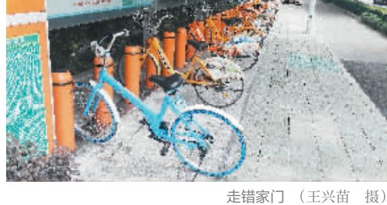
走错家门 (王兴苗 摄)