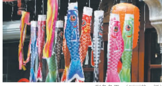
彩色鱼干