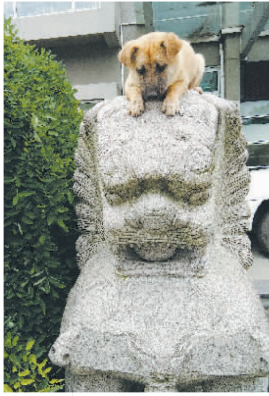
狮子头上打瞌睡