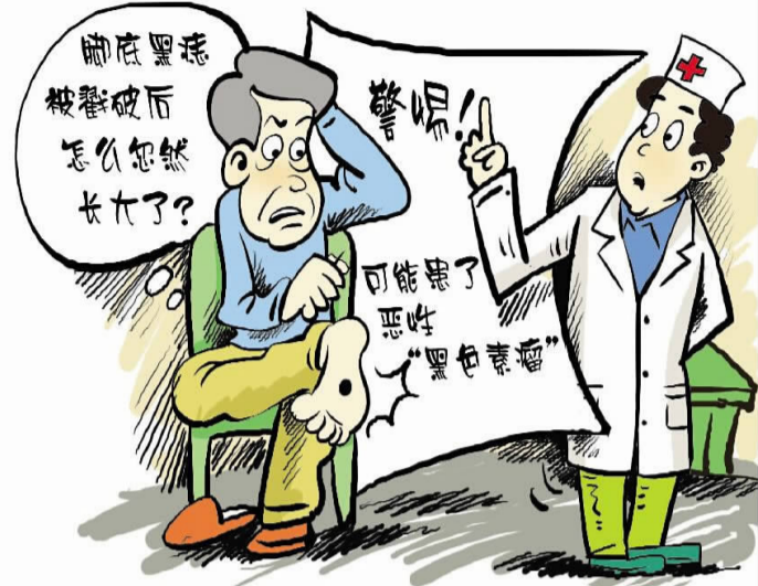
本报讯(通讯员 蔡微娜 张婧秋 记者 肖凯)12岁