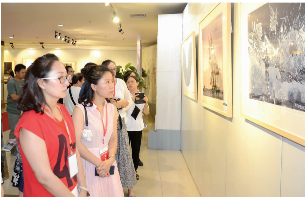
图为市民认真观看版画作品。