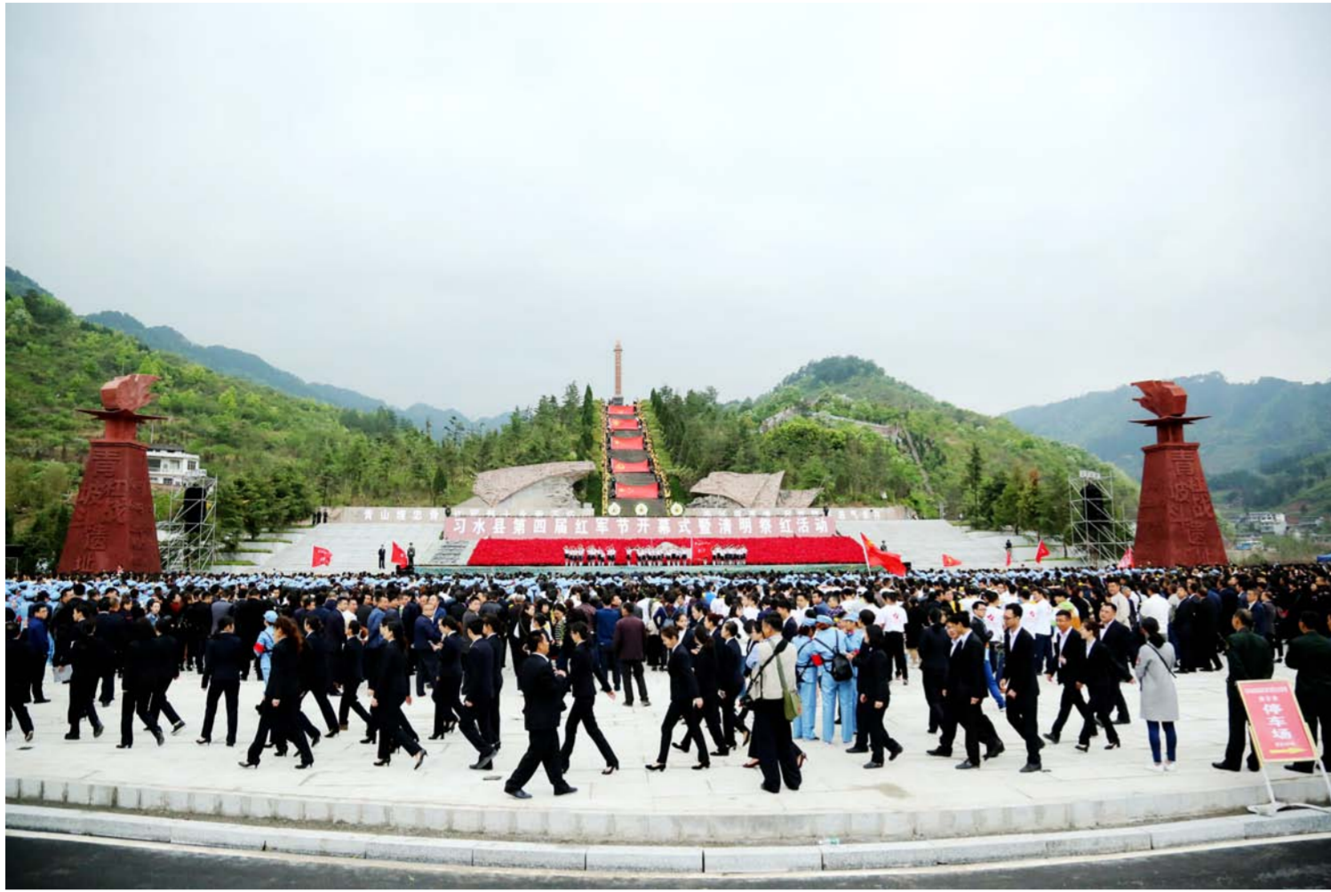
习水县第四届红军节开幕式暨清明祭红活动

4月5日,习水县第四届红军节暨文化旅游推介会成功举行。当天,习水举行了习水县第四届红军节开幕式暨清明祭红活动、女红军纪念馆改陈开放仪式、中国红色诗会暨中国报告文学习水创作基地签约仪式、“诗和远方·相遇习水”习水县文化旅游推介会、“鰾国故里·土城印象”大型文艺晚会等系列活动。此次活动社会影响广泛,获得省市乃至全国数十家主流媒体的关注和转载,进一步提升了习水的知名度和美誉度。