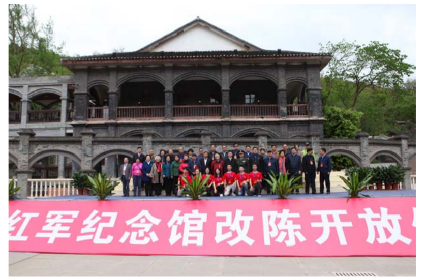
女红军纪念馆改陈开放仪式