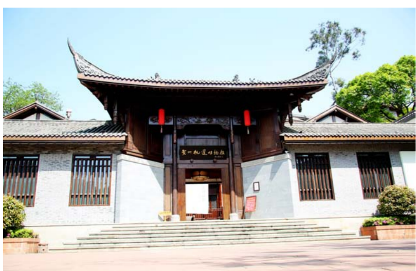
贵州航运博物馆