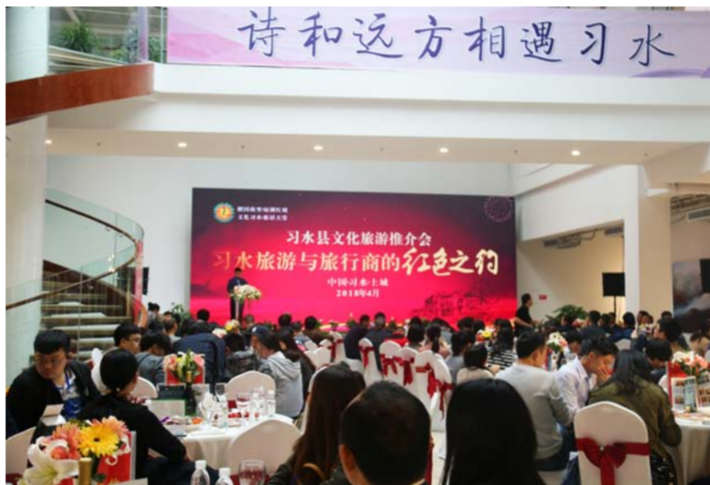
“诗和远方·相遇习水”习水县文化旅游推介会