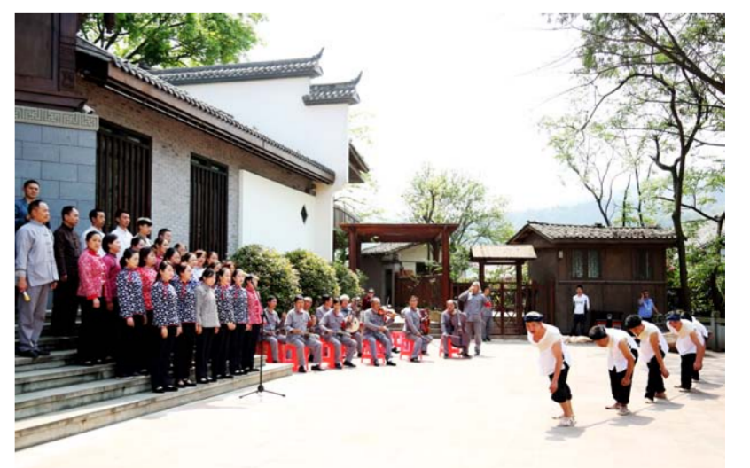
赤水河畔的船帮号子和长征组歌