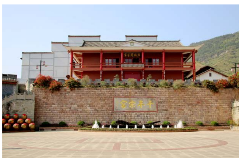
位于千年古镇土城的宋窖博物馆